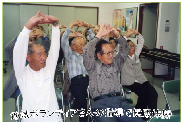
地域ボランティアさんの指導で健康体操

サロンに出掛け、人と会い、話し、笑い、歌い、ゲームをしたり、お茶を飲んだりなど楽しい時間を過ごすことは、適度な精神的刺激となり、気持ちに余裕ができます。