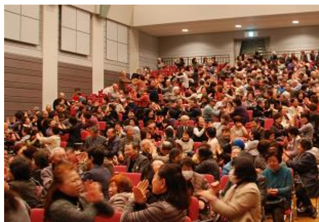
サロン交流会での様子