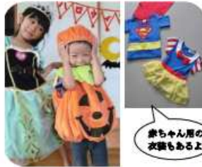
赤ちゃん用の 衣装もあるよ

お母さん同士の情報交換もできます。ぜひお気軽にご参加ください。 詳細は裏面をご覧ください。