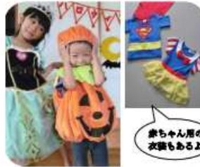
赤ちゃん用の 衣装もあるよ

お母さん同士の情報交換もできます。ぜひお気軽にご参加ください。 詳細は裏面をご覧ください。