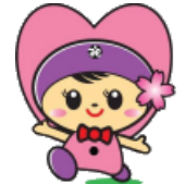
高崎市社協 イメージキャラクター 「たかちゃん」