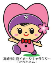
高崎市社協イメージキャラクター「たかちゃん」