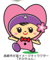
高崎市社協イメージキャラクター「たからちゃん」

お問い合わせ先・申込先 社会福祉法人 高崎市社会福祉協議会 高崎市福祉人材バンク 〒370-0045 高崎市東町80-1 (高崎市労使会館1階) TEL: 027-324-2761 利用時間: 9時~16時 (平日)