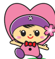
高崎市社協イメージキャラクター 「たかちゃん」

社会福祉法人 高崎市社会福祉協議会 高崎市福祉人材バンク 〒370-0045 高崎市東町 80-1 (高崎市労使会館 1 階) TEL: 027-324-2761 利用時間: 9 時~16 時 (平日) メールアドレス tsk-jinzai@oboe.ocn.ne.jp