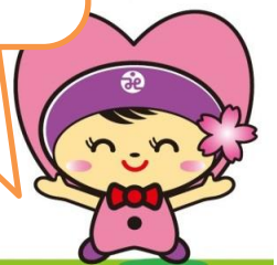
高崎市社協イメージキャラクター 「たかちゃん」

※新型コロナウイルス感染拡大の状況により、イベントが中止になる場合があります。予めご了承ください。