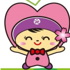
高崎市社協イメージキャラクター 「たかちゃん」