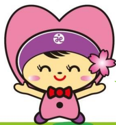
高崎市社協イメージキャラクター 「たかちゃん」