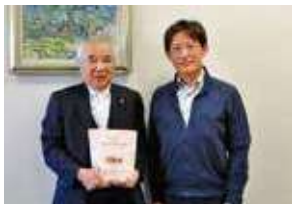
▲Hawaii Love in GUNMA 実行委員会様