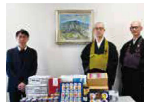
▲群馬県曹洞宗青年会様