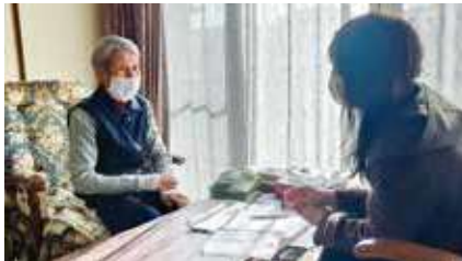
高齢者等買物代行