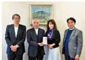
▲高崎市の未来を考える会様