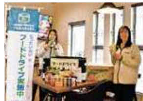
▲株式会社ユタカペイント様