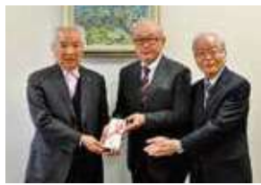
▲高崎市自立経営農家 研究協議会様