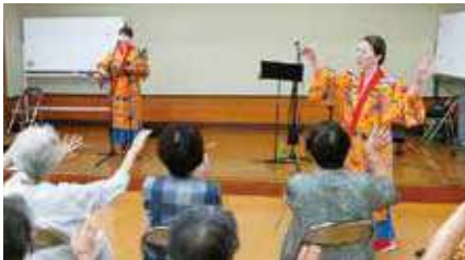
芸能ボランティア