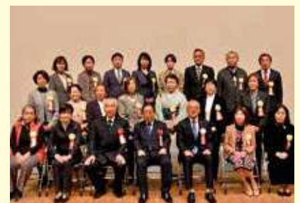
▲受賞者の皆さんおめでとうございます