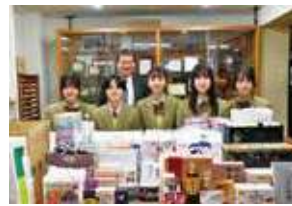
▲高崎経済大学附属高等学校JRC インターアクト部様