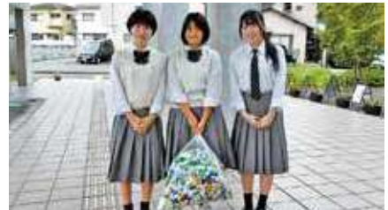
ペットボトルキャップ受け入れ

ボランティアに関する詳細は、社協ホームページをご覧ください。027-370-8855までお電話ください。