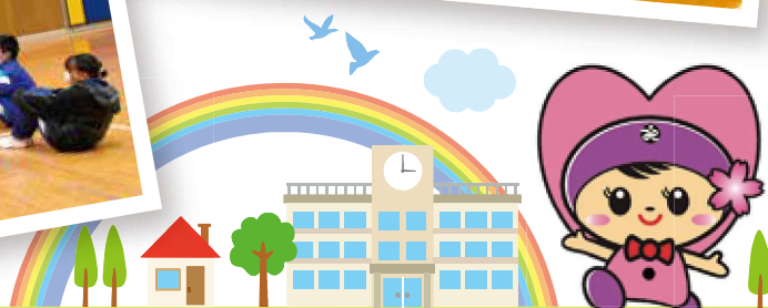
高崎市社協イメージキャラクター 「たかちゃん」